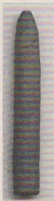
Sigaar met papieren dekblad